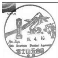
富士山五合目簡易郵便局

富士山五合目の簡易郵便局(3月15日~翌年1月15日まで開設)へ行くと風景の消印が押してもらえます。また、富士山頂郵便局も平成25年は7月13日~8月25日まで開設しており、風景印の押印やまた、登山証明書・富士山登頂記録・専用クリアファイルをセットで販売しています。