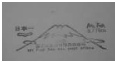
こんなスタンプもあります