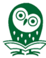
図書館マスコットキャラクター オウちゃん