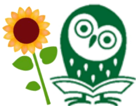
マスコットキャラクター オウちゃん