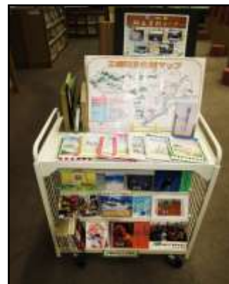
↑上段④「三郷町郷土資料コーナー」 下段⑤「三郷町ゆかりの作家」による資料