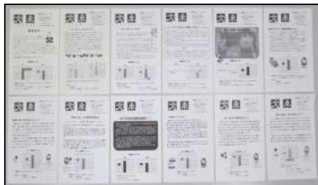
↑①図書館広報誌「文車」