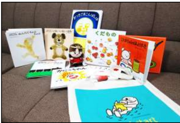
『ブックスタートパック』