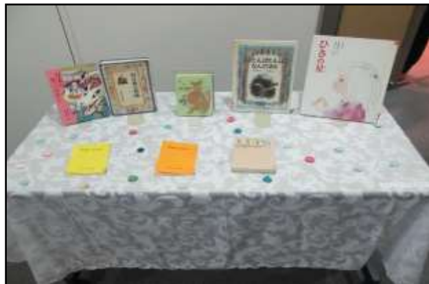
3月『大人のためのストーリーテリング』