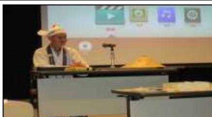
10月『四国八十八ヶ所講演会』