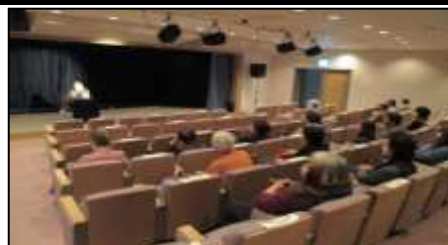
3月『大人のためのストーリーテリング』